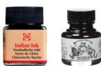
Exemple de flacons d'encre de chine