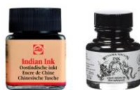
Exemple de flacons d'encre de chine